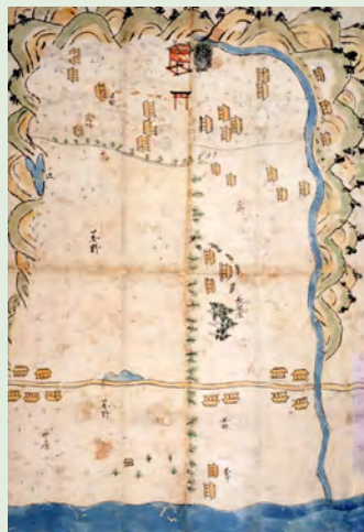
日根野村・井原村荒野開発絵図