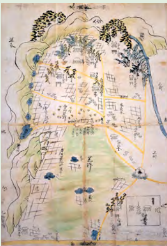
日根野村荒野開発絵図