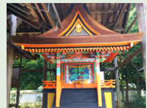
火走神社摂社幸神社本殿